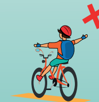
ЕЗДИТЬ БЕЗ РУК, ИЛИ УБРАВ НОГИ С ПЕДАЛЕЙ.

ПРИ ОТСУТСТВИИ ВЕЛОДОРОЖКИ ПРИДЕРЖИВАЙСЯ ПРАВОГО КРАЯ ДОРОГИ, НЕ ЛАВИРУЙ В ПОТОКЕ АВТОМОБИЛЕЙ!