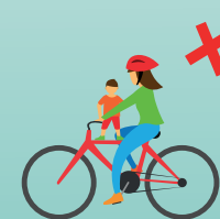
ПЕРЕВОЗИТЬ ПАССАЖИРОВ, ЕСЛИ ЭТО НЕ ПРЕДУСМОТРЕНО КОНСТРУКЦИЕЙ ВЕЛОСИПЕДА!